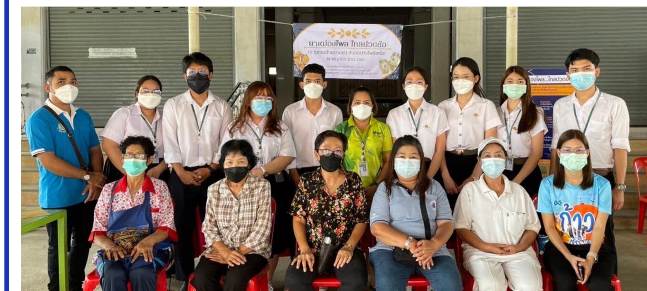
*ภาพประกอบที่ใช้ในโครงการได้ขออนุญาตจากผู้เข้าร่วมโครงการแล้ว